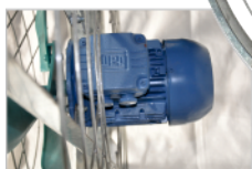
BLINDADO Y VENTILADO